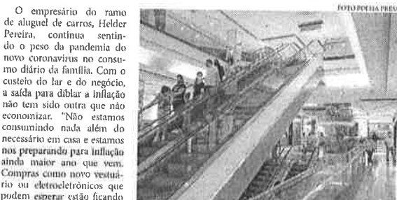
Consumo das famílias tem peso grande na economia, mas poder de compra da população tem sido reduzido frente à inflação dos preços de produtos e serviços

Mais informações de Rubens Frolta: e-mail: frolta@brasil.com.br