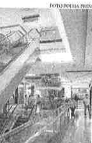
Consumo das famílias tem peso grande na economia, mas poder de compra da população tem sido reduzido frente à inflação dos preços de produtos e serviços

O IBGE também informou que os investimentos produtivos na economia brasileira, medidos pelo indicador Formação Bruta de Capital Fixo, caíram 3,6% no segundo trimestre. Na contramão, as exportações avançaram 9,4% entre abril e junho, pois na teoria, o dólar alto incentiva os embarques. Já as importações, que ficam mais caras com a moeda americana, tiveram queda de 0,6% no segun-