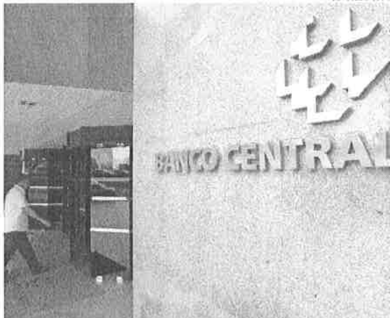
O volume de investimentos em novembro ficou acima da previsão do BC para o mês, que era de US$ 3,9 bilhões

O ingresso dessas aplicações no país foi impactado pela pandemia de covid-19, que despencaram em 2020, caindo pela metade se comparado a 2019. No geral, foram aportados US$ 37,8 bilhões no país no período (2020), contra US$ 69,1 bi-