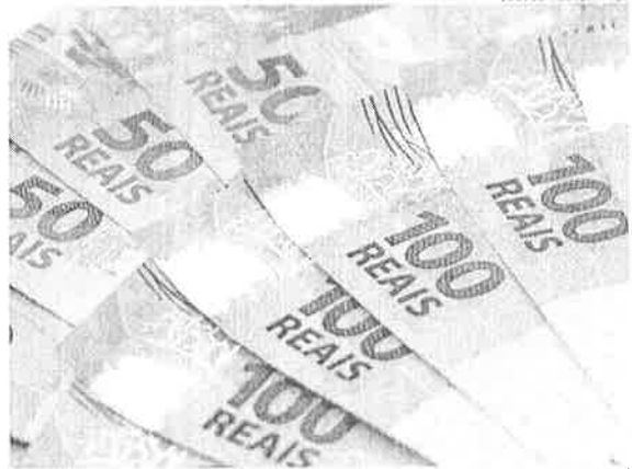
As vendas de títulos com prazo de um a cinco anos representaram 61,1% e aquelas com prazo de 5 a 10 anos, 29,3% do total

Os títulos remunerados por índices de preços respondem pelo maior volume