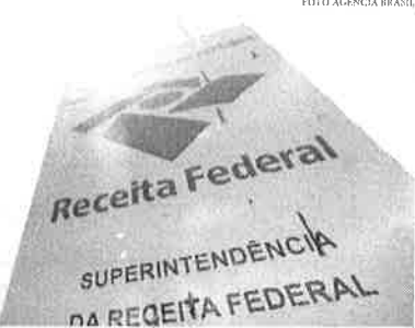
Os litígios envolvem a consideração de despesas com ágio em participações societárias

O valor representa a soma de todos os créditos tributários em disputa envolvendo duas das maiores controvérsias jurídicas em litígio na Receita Federal, que significa um total de R$ 122 bilhões de todo o conteúdo administrativo em tramitação, que no total é de R$ 1,7 trilhão. Os litígios envolvem a consideração de despesas com ágio em participações societárias para o cálculo da amortização de impostos. Este é o segundo edital de transação tributária lançado com o objetivo de quanto contribuintes como o Poder Público abram mão