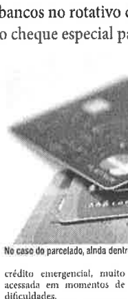
NO CASO DO PARCELADO, ALINDA DENTRO DE CARTÃO DE CRÉDITO, O JURO PASSOU DE 172,5% PARA 174,3% AO ANO

O rotativo do cartão, juntamente com o cheque especial, é uma modalidade de