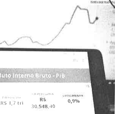
A exportação de bens e serviços que subiu 9,6% no primeiro trimestre, em comparação ao mesmo período do ano passado

Já a Formação Bruta de Capital Fixo (FBCF) registrou crescimento de 1,5% no primeiro trimestre, em comparação ao mesmo trimestre do ano passado. Desde o quarto trimestre do ano passado, a análise da taxa trimestral móvel apresenta queda no componente de máquinas e equipamentos, encerrando o período com retração de 4,8%. As quedas continuam disseminadas entre os segmentos de automóveis, máquinas e equi-