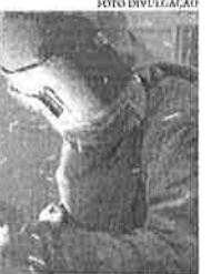
do estado. "Este é o resultado negativo mais intenso para o estado desde março de 2020, quando atingiu a taxa de -16%", afirmou o analista.

mais influenciou o resultado do Paraná, seguido de máquinas e equipamentos, outro setor bastante importante na indústria do estado", informou Almeida. Para ele, houve um "espalhamento" de resultados positivos em maio. O Pará, com taxa negativa de 13,2%, teve o recuo mais elevado, causado pelo baixo desempenho do setor extrator, que concentra a maior parte da atividade industrial