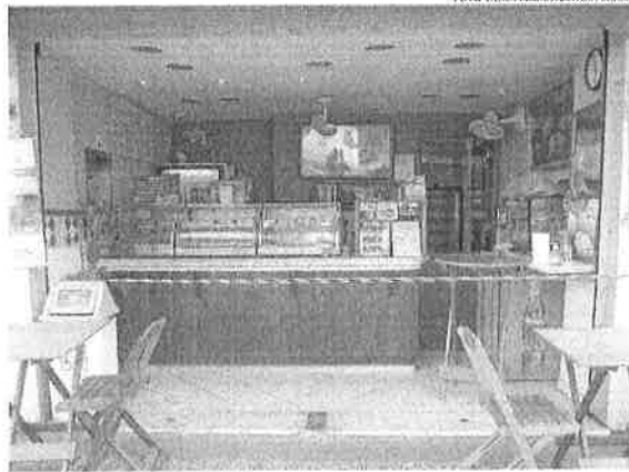
Atualmente, os negócios de menor porte correspondem a 30% do PIB

A pesquisa constatou que, de 15,3 milhões de donos de pequenos negócios em atividade no Brasil, 11,5 milhões dependem exclusivamente da atividade empresarial para sobreviver. Em relação aos MEI, a proporção chega a 78%, o que equivale a cerca de 6,7 milhões de pessoas. Entre os donos de micro e pequenas empresas, 71% têm no negócio de pequeno