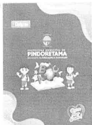
LOTE / ITEM 6.4 - SQUEEZE.