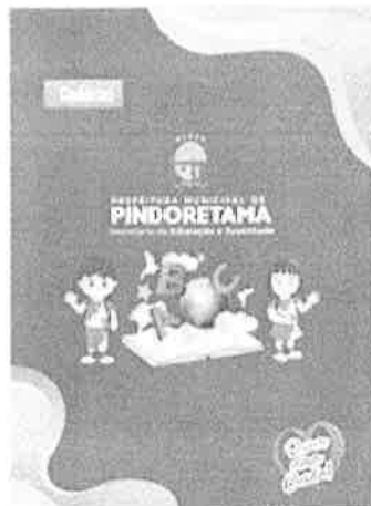
LOTE / ITEM 3.4 - SQUEEZE.