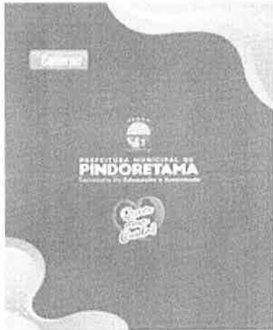
LOTE / ITEM 1.3 - ESTOJO.