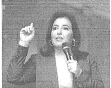
De acordo com Tebet, o governo Lula vê essa reforma como ideal para desburocratizar a iniciativa privada e acelerar o crescimento

A tão aguardada reforma tributária sairá ainda em 2023. Foi o que anunciou o ministro do Planejamento, Simone Tebet, nessa segunda (13/02). A proposta de reforma deve ser aprovada neste ano pelo Congresso, mas ela não pode "dizer em quantos meses". No início do mês, a ministra havia afirmado, após reunião com o presidente da Câmara, Arthur Lira, que a discussão do projeto de prolongaria no Legislativo por ao menos seis meses. A afirmação, no entanto, é contrária à do titular da Fazenda, Fernando Haddad, e com a do vice-presidente Geraldo Alckmin. Eles dizem que a proposta poderia ser aprovada ainda no primeiro semestre deste ano. Lira, que já sinalizou disposição para levar o texto ao plenário entre 60 e 90 dias, e o presidente do Senado, Rodrigo Pacheco, devem se reunir para discutir os detalhes do rito.