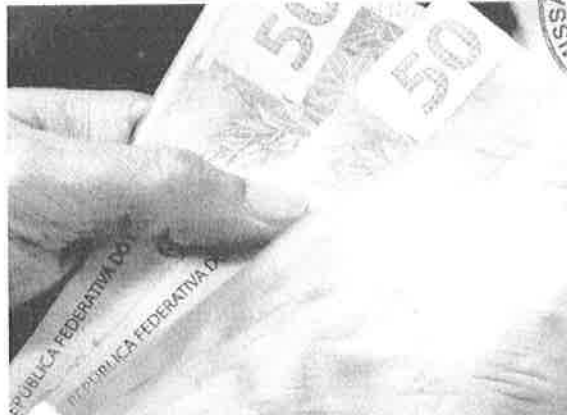
O novo valor deve entrar em vigor em 1º de maio. Dia Internacional do Trabalho. Atualmente, o mínimo é de R$ 1.302

O presidente disse ainda que o mínimo terá, além da reposição inflacionária, o crescimento do PIB. "Porque a e forma mais justa de você distribuir o crescimento da economia. Não adianta o PIB crescer 14% e você não distribuir. É importante que ele cresça 5%, 6%, 7% e você distribua para a sociedade. Nós vamos aumentar o salário mínimo todo ano de acordo com a inflação, será revista, e o crescimento do PIB será colocado