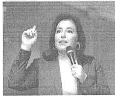
De acordo com Tebet, o governo Lula vê essa reforma como ideal para desburocratizar a iniciativa privada e acelerar o crescimento

primeiro semestre no Congresso. É provável que essa seja a primeira Proposta de Emenda à Constituição (PEC) de interesse do Palácio do Planalto a ser votada no Legislativo. De acordo com Tebet, o governo Lula vai essa reforma como ideal para desburocratizar a iniciativa privada e acelerar o crescimento e a geração de emprego. Para a ministra, mudanças na tributação sobre a renda