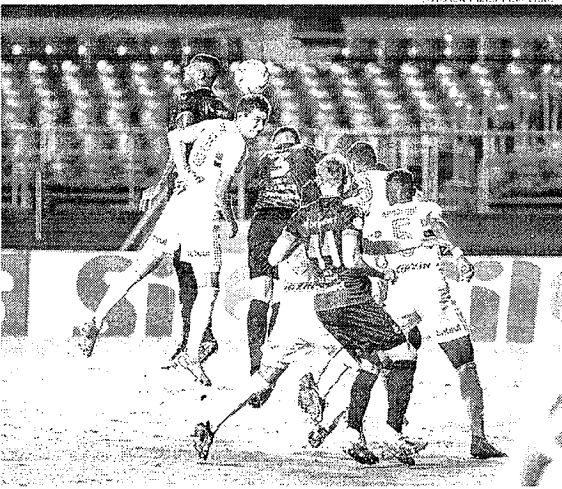
Fortaleza alcança segunda vitória seguida na competição ao mesmo tempo que Ceará tem terceira partida sem resultado positivo

Após a derrota pelo o Corinthians na última quarta (03), o alvinegro