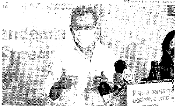
O prefeito de Fortaleza, José Sarto (PPD), deslancha ideia que visa a população e sua prioridade neste momento

O prefeito de Fortaleza, José Sarto (PPD), informou na tarde deste domingo (28), sobre a iniciativa com os demais gestores municipais para a criação de um consórcio público para aquisição de vacinas contra a Covid-19. O anúncio foi publicado em suas redes sociais.