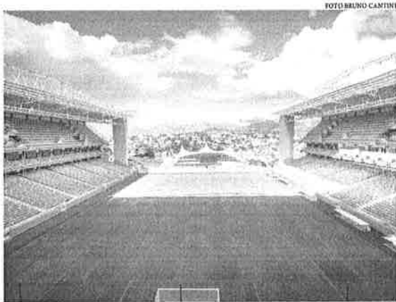
A partida entre Palmeiras e São Bento, pela terceira rodada do paulista, será jogada no Independência, em Belo Horizonte

Além do jogo entre Palmeiras e São Bento, a vigência da restrição afeta diretamente três rodadas (quinta a sétima) e dois confrontos entre clubes de São Paulo na primeira fase da Copa do Brasil.