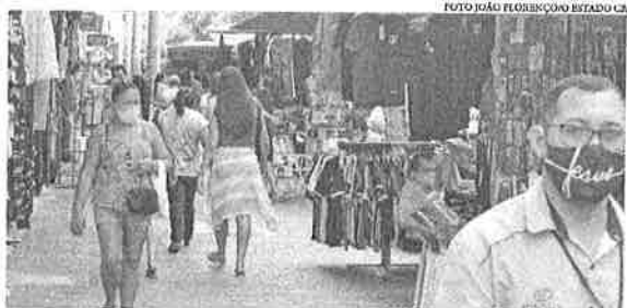
Medida vai contemplar 5.400 feirantes, ambulantes, artesãos e comerciantes de Fortaleza em duas parcelas de R$ 100

Os beneficiários dessa ação da prefeitura são feirantes, ambulantes, artesãos