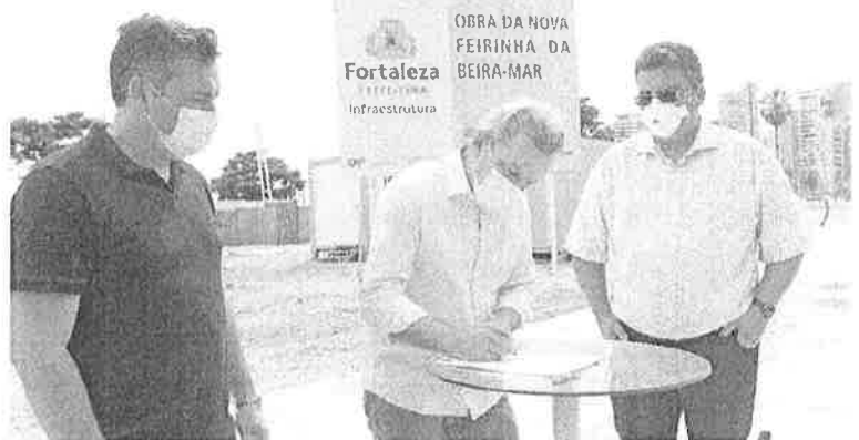
OBRA DA NOVA FEIRINHA DA BEIRA-MAR