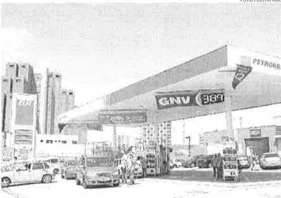
Segundo a estatal, valor médio de venda do combustível para distribuidores será reduzido em R$ 0,10, passando de R$ 3,19 para R$ 3,09 por litro

Por meio de nota, a empresa disse que o ajuste "reflete, em parte, a evolução dos preços internacionais e da taxa de câmbio, que se estabilizaram em patamar inferior para a gasolina".